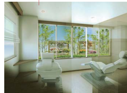
外来でのガン患者様の化学療法室設置